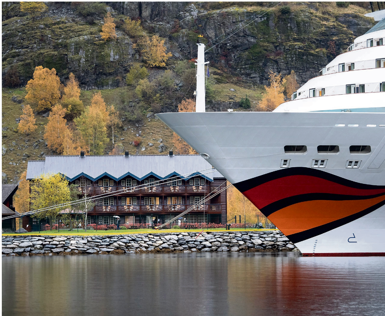
RÅTT PARTI: Flåmsbrygga hotell blir lite med sine 41 rom når cruiseskipet «Aida Mar» legger til kai med 2686 passasjerer. Flåm har 300 innbyggere og mottar hvert år 3000 ganger flere turister enn bygden har fastboende.

- Gondolbane er tingen nå. De mener det vil være en turistmagnet og skape arbeidsplasser. Nå vil de ha bane opp det